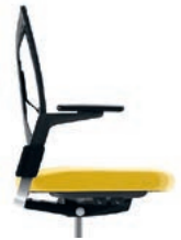
_1 Synchronous mechanism Synchroon mechaniek