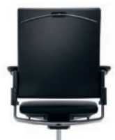
_1 Lumbar support Lumbaalsteun